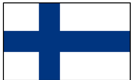
fēn lán 芬兰