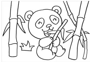
xióng māo 熊猫