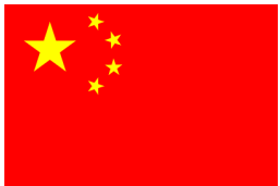
zhōng guó 中国